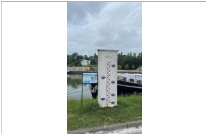
Repère de crue Maurecourt