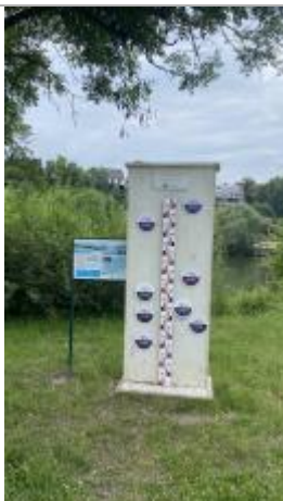
Repère de crue Maurecourt