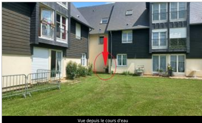
Vue depuis le cours d'eau