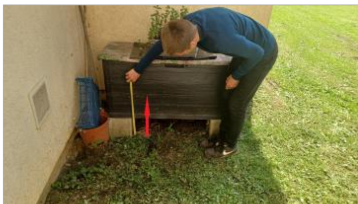
Laisse de crue à 42 cm/sol

SOURCE DE REPÉRAGE : VISITE DE TERRAIN SPC SACN - 11/03/2020