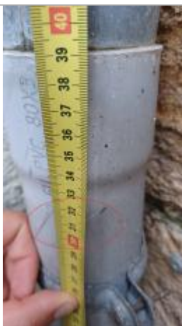
Laisse de crue à 31 cm/sol

Organisme(s) : SPC Seine aval - Côtiers normands