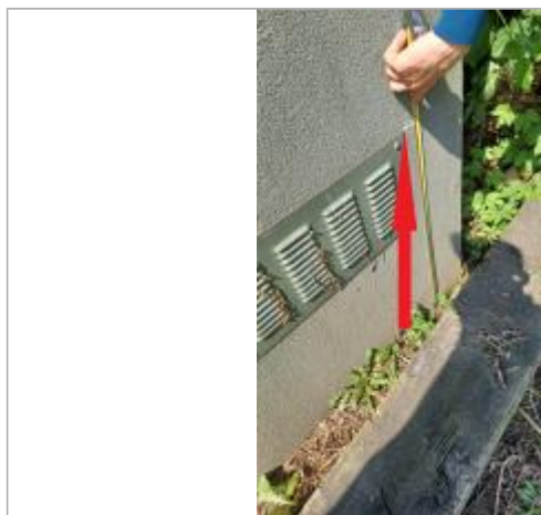
Laisse de crue à 64 cm/sol.