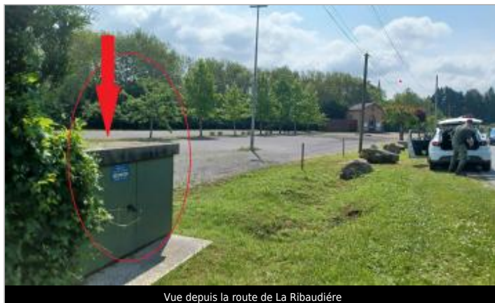
Vue depuis la route de La Ribaudière