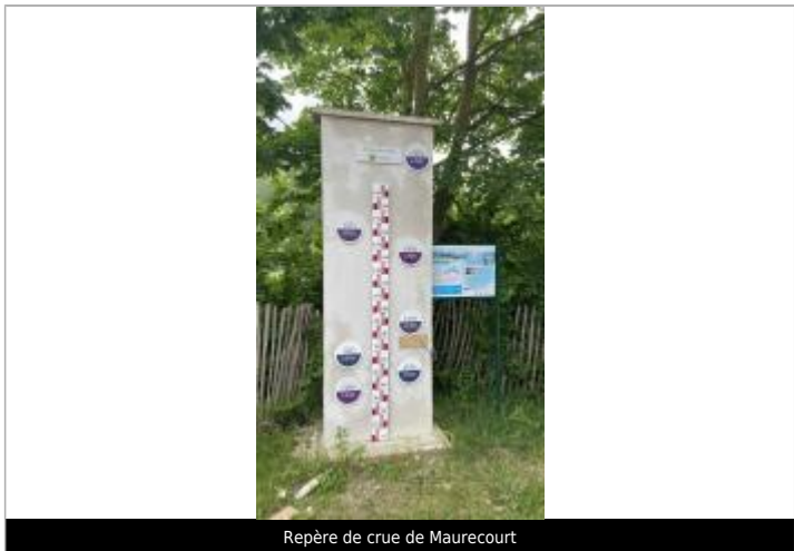
Repère de crue de Maurecourt

Maximum de l'inondation : Oui Visibilité : Oui