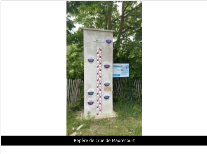
Repère de crue de Maurecourt