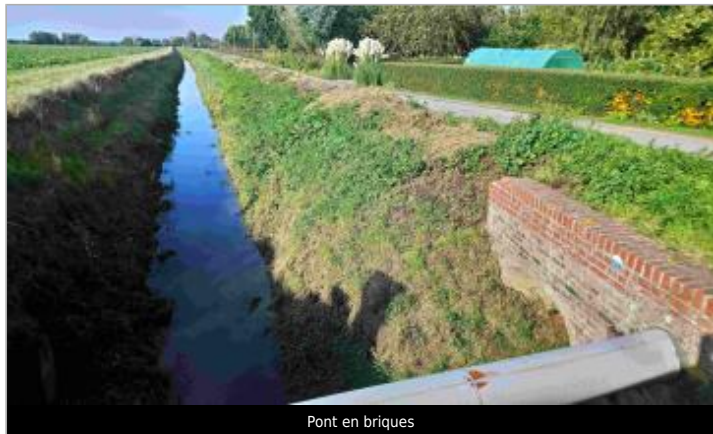
Pont en briques