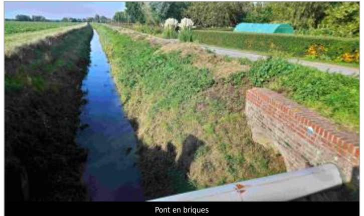
Pont en briques