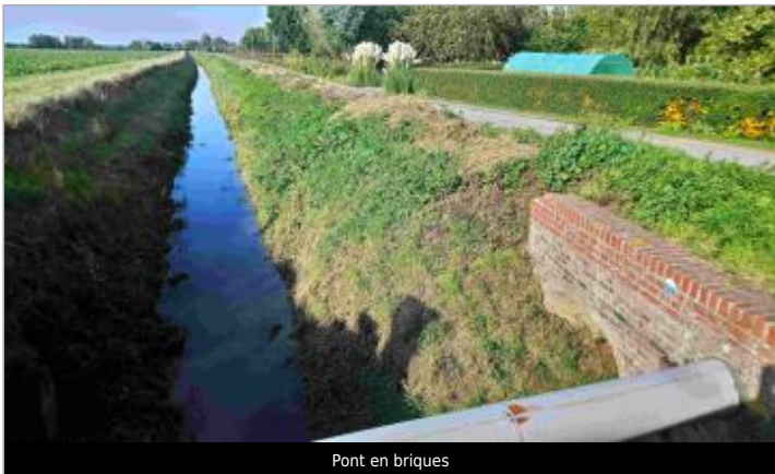
Pont en briques