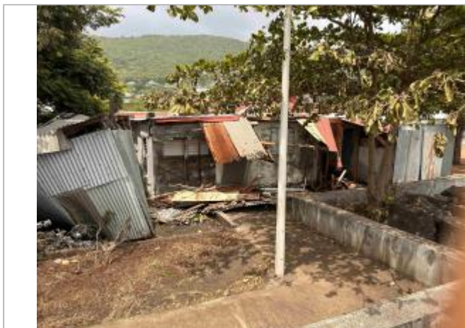
Maison détruite par les vagues