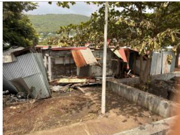
Maison détruite par les vagues

Coordonnées WGS84 : X: -61.78693500 / Y: 16.22818780