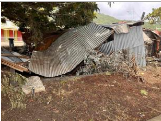
Maison détruite par les vagues