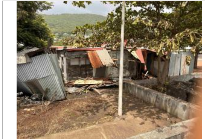
Maison détruite par les vagues