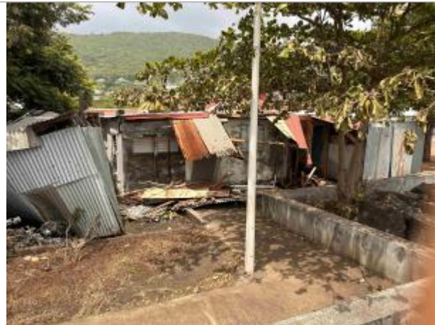
Maison détruite par les vagues