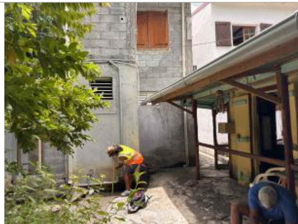
Témoignage d'une hauteur d'eau

Coordonnées RGF93 (ETRS89) : X: -61.788841 / Y: 16.230068