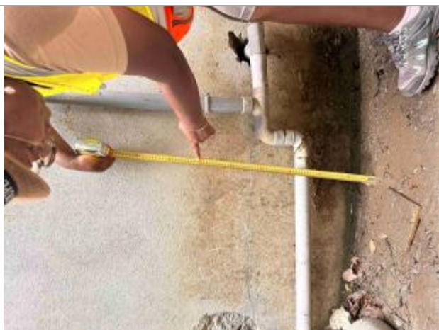
Témoignage de la hauteur d'eau atteinte

Altitude calculée de l'eau (en m) : 0.464