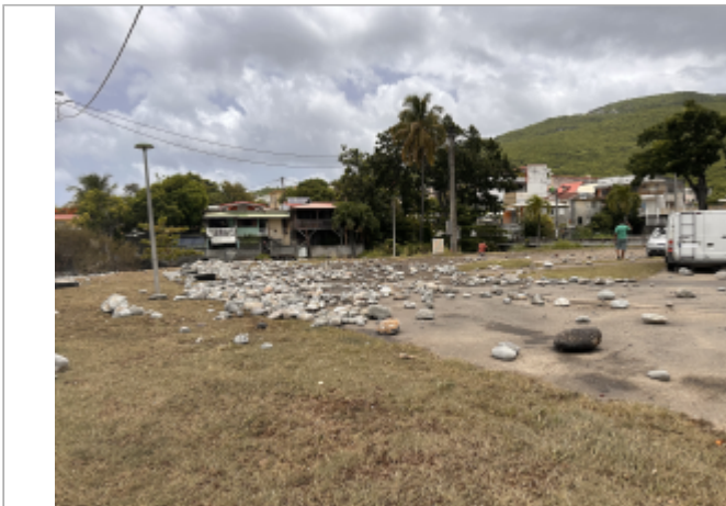
Vue de l'emprise inondée depuis la mer