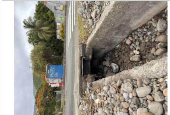
Inondation jusque sur la route et buse encombrée par des dépôts (galets, sables)