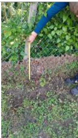
Laisse de crue à 37 cm/sol

Altitude calculée de l'eau (en m) : 96.75 m