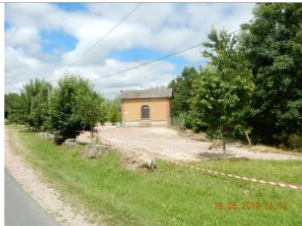
Le bouldrome à l'amont