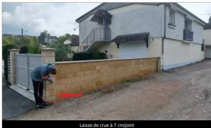
Laisse de crue à 7 cm/joint