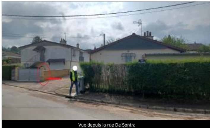
Vue depuis la rue De Sontra

Coordonnées WGS84 : X: 0.20215377 / Y: 48.92188190