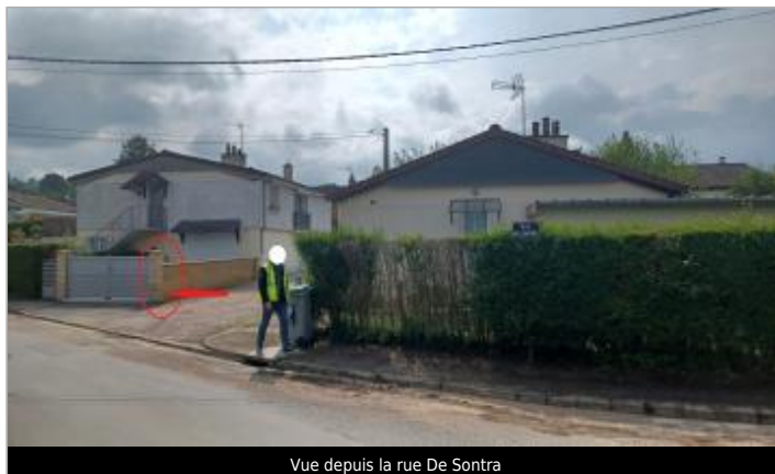
Vue depuis la rue De Sontra