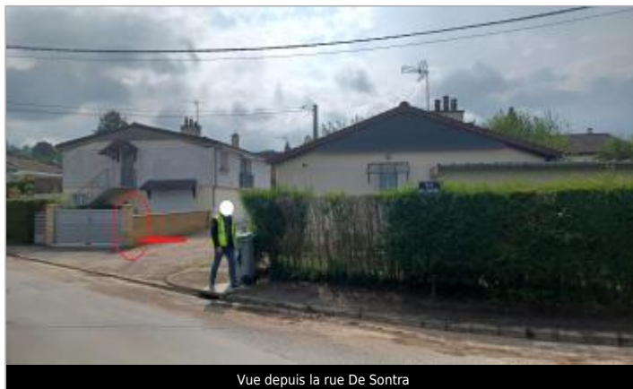
Vue depuis la rue De Sontra