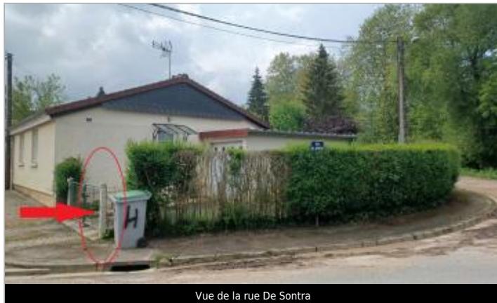
Vue de la rue De Sontra

Coordonnées WGS84 : X: 0.20204136 / Y: 48.92187090