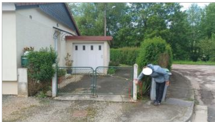
Laisse de crue à 30 cm/sol

SOURCE DE REPÉRAGE : VISITE DE TERRAIN SPC SACN - 11/03/2020