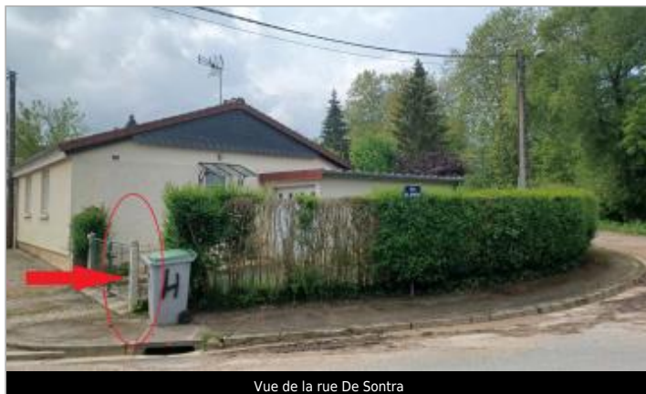
Vue de la rue De Sontra

Coordonnées WGS84 : X: 0.20204136 / Y: 48.92187090