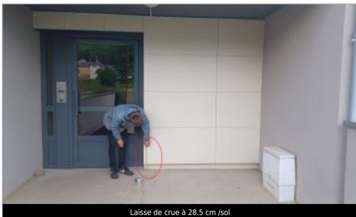
Laisse de crue à 28.5 cm /sol