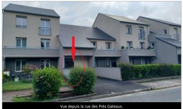
Vue depuis la rue des Prés Gateaux.

Coordonnées WGS84 : X: 0.19966339 / Y: 48.92443910