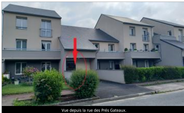
Vue depuis la rue des Prés Gateaux.