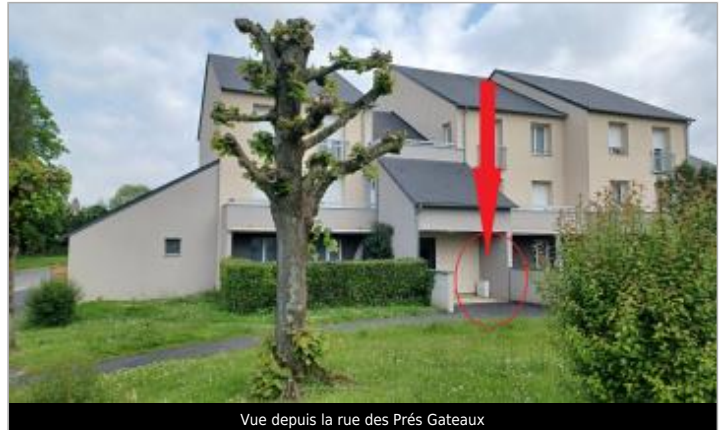
Vue depuis la rue des Prés Gateaux

Coordonnées WGS84 : X: 0.19941997 / Y: 48.92489410