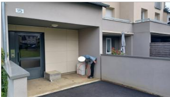
Laisse de crue à 17.5 cm/sol

Altitude calculée de l'eau (en m) : 99.775 m