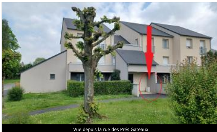
Vue depuis la rue des Prés Gateaux