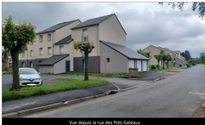
Vue depuis la rue des Prés Gateaux