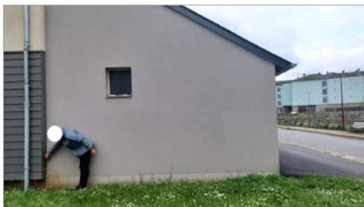
Laisse de crue à 41.5 cm/sol

SOURCE DE REPÉRAGE : VISITE DE TERRAIN SPC SACN - 11/03/2020