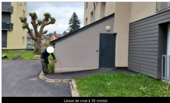
Laisse de crue à 35 cm/sol.

SOURCE DE REPÉRAGE : VISITE DE TERRAIN SPC SACN - 11/03/2020