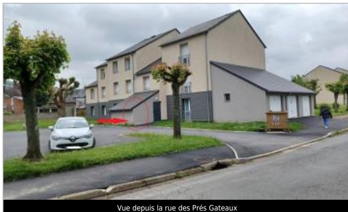
Vue depuis la rue des Prés Gateaux