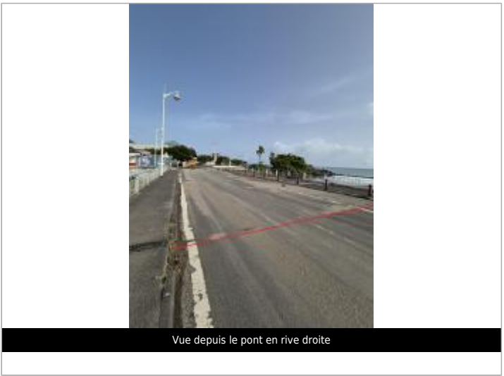
Vue depuis le pont en rive droite