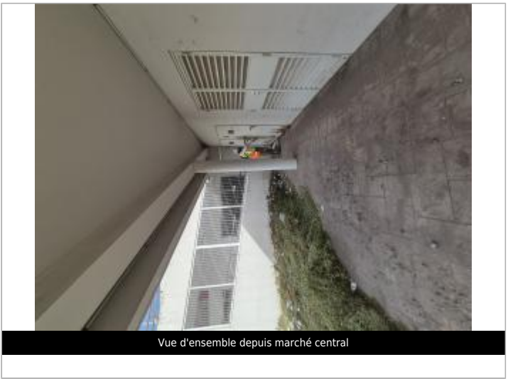
Vue d'ensemble depuis marché central