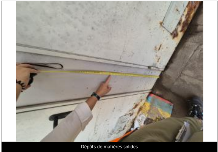
Dépôts de matières solides