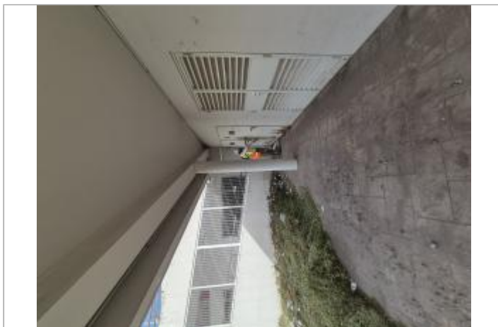
Vue d'ensemble depuis marché central