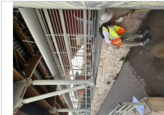
Vue ensemble - entrée côté parking Silot