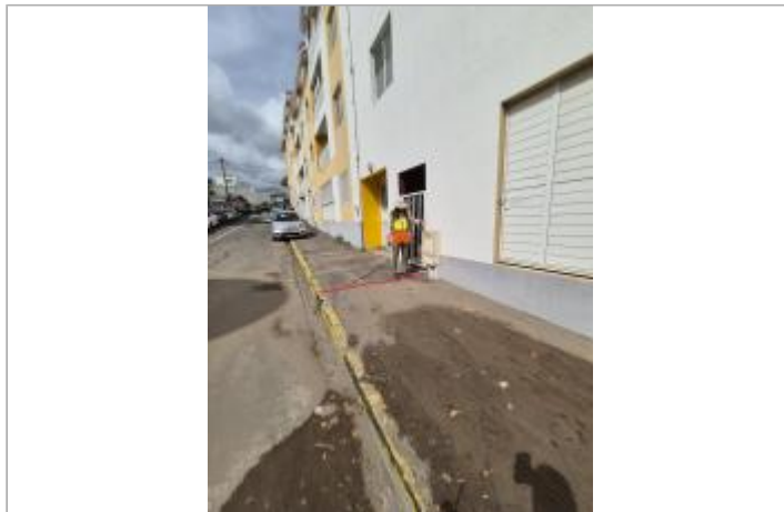
Limite de l'emprise inondée