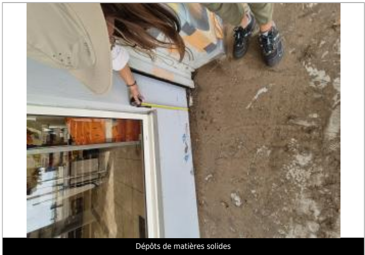
Dépôts de matières solides