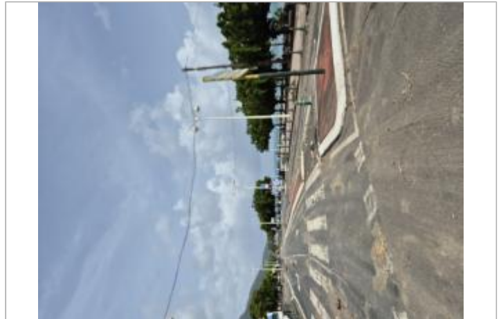
Zone inondée jusqu'en haut du rond point