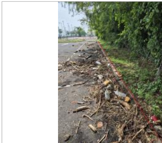
Limite de l'emprise inondée

Coordonnées WGS84 : X: -61.72504310 / Y: 15.98805590