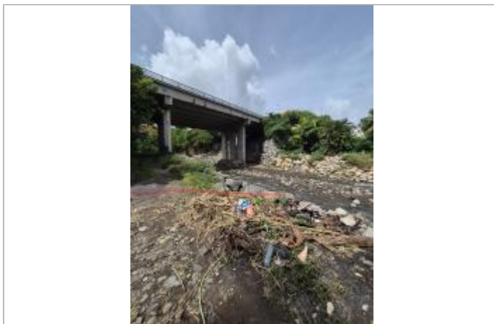
Vue d'ensemble - rive droite