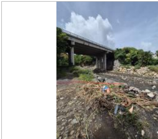
Vue d'ensemble - rive droite

Coordonnées WGS84 : X: -61.72256570 / Y: 15.98609950