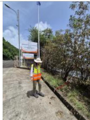
Vue depuis l'entrée de la carrière

Coordonnées RGF93 (ETRS89) : X: -61.7138037 / Y: 15.9789258