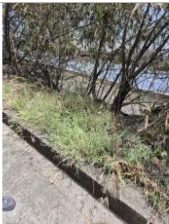
Applatissement de la végétation qui délimite l'emprise de zone inondée