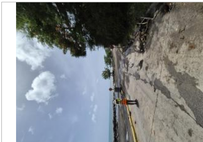
Entrée route vers la sablière