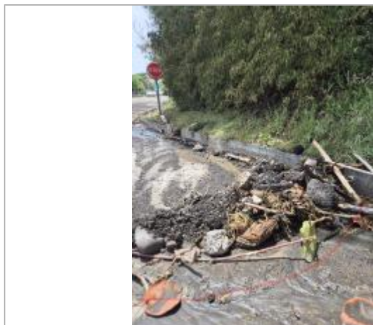
Emprise de la zone inondée

SOURCE DE REPÉRAGE : CAMPAGNE TERRAIN POST-INONDATION BÉRYL (02/07/2024) -