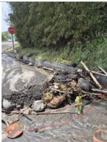
Emprise de la zone inondée