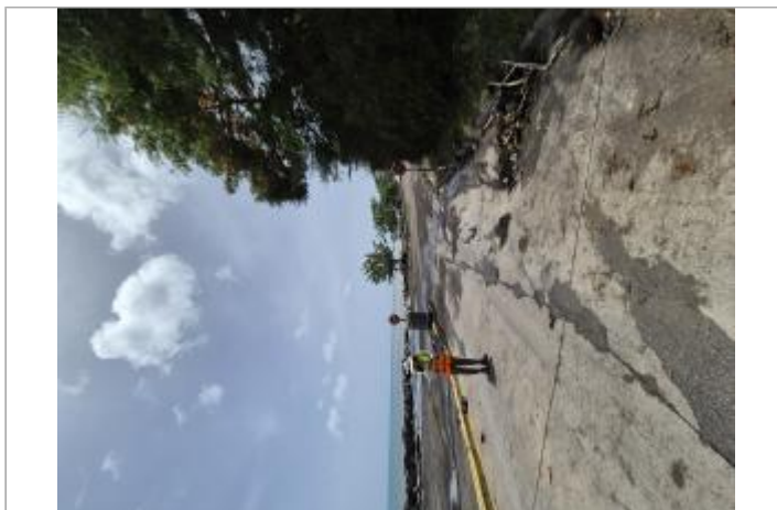
Entrée route vers la sablière