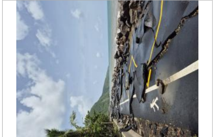
Destruction chemin bétoné