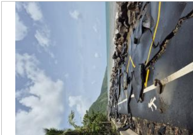
Destruction chemin bétoné