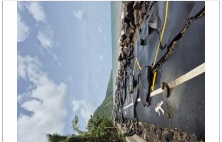
Destruction chemin bétoné