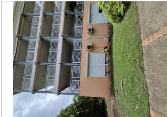
Vue d'ensemble - façade côté parking

Coordonnées WGS84 : X: -61.71860400 / Y: 15.98453740