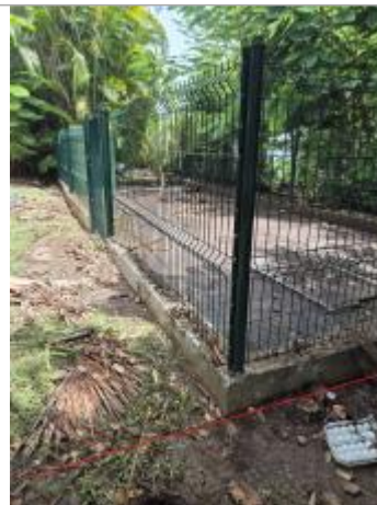
Emprise de la zone inondée au niveau de l'infrastructure (côté portillon)