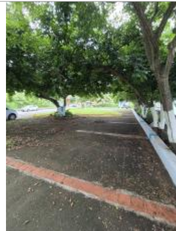
Emprise de la zone inondée

Coordonnées RGF93 (ETRS89) : X: -61.7760848 / Y: 16.1547541