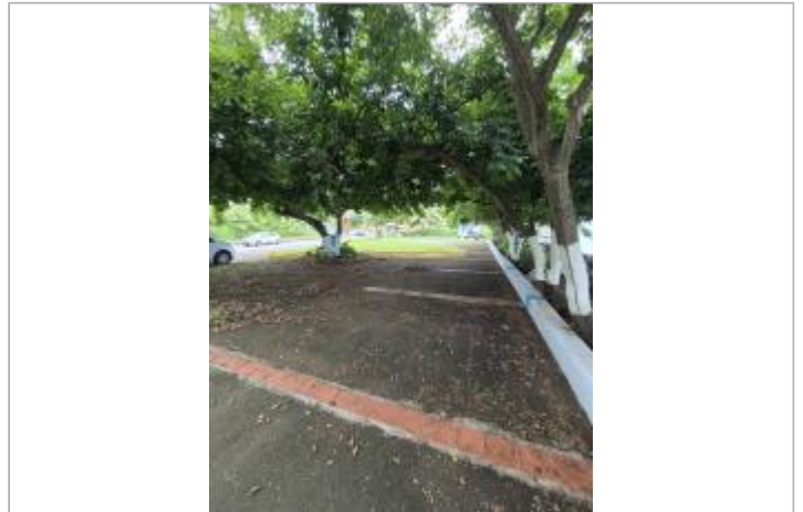
Emprise de la zone inondée