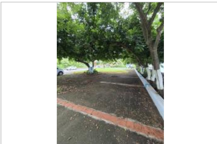
Emprise de la zone inondée

GÉOLOCALISATION Coordonnées WGS84 : X: -61.77608480 / Y: 16.15475410 (RRAF 91)UTM 20N X: 630855.81 / Y: 1786442.44 Coordonnées RGF93 (ETRS89) : X: -61.7760848 / Y: 16.1547541