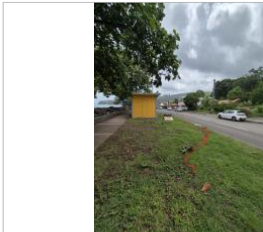
Emprise de la zone inondée

Coordonnées WGS84 : X: -61.77627330 / Y: 16.15686900