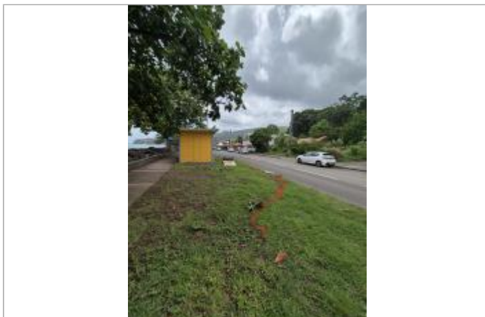
Emprise de la zone inondée