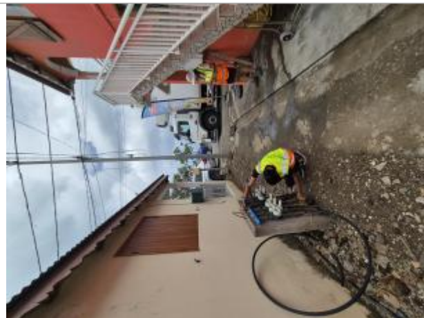
Compteurs d'eaux à proximité de l'épicerie