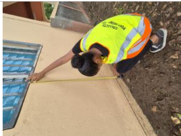
Vue d'ensemble - façade côté route