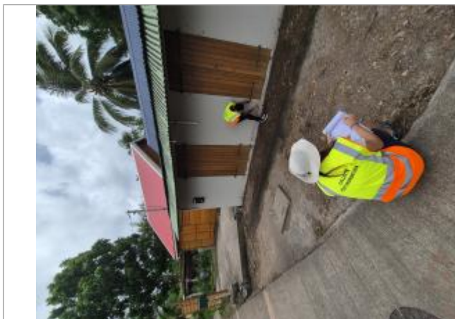
Vue d'ensemble, façade côté route