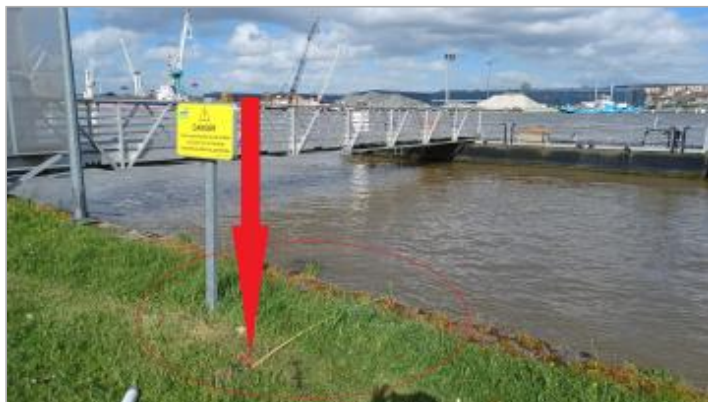
Vue depuis la berge en aval

Coordonnées WGS84 : X: 1.00825277 / Y: 49.38559860