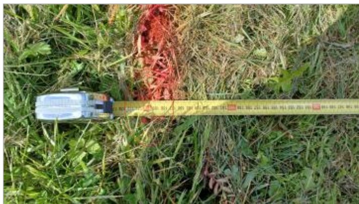
Laisse de crue au sol à 170 cm/bord du quai