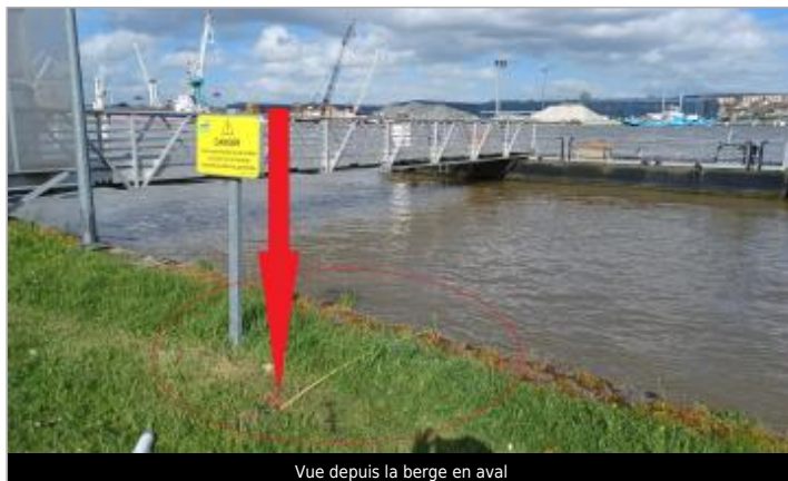
Vue depuis la berge en aval