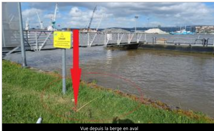
Vue depuis la berge en aval