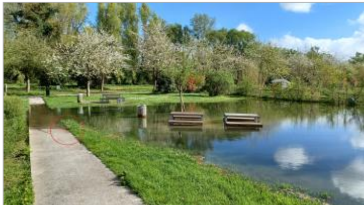
Vue depuis le Quai Napoleon.

Coordonnées WGS84 : X: 1.00438561 / Y: 49.37927020