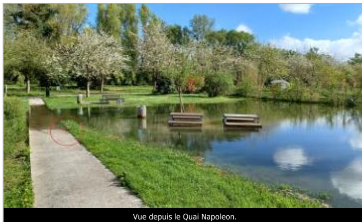
Vue depuis le Quai Napoleon.

GÉOLOCALISATION Coordonnées WGS84 : X: 1.00438561 / Y: 49.37927020 Coordonnées RGF93 (Lambert 93) X: 555058.92 / Y: 6921804.77 Coordonnées RGF93 (ETRS89) : X: 1.0043856 / Y: 49.3792702 Code Hydro: ----0010 Rive de référence: Droite