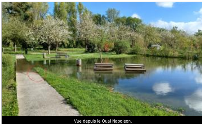
Vue depuis le Quai Napoleon.

GÉOLOCALISATION Coordonnées WGS84 : X: 1.00438561 / Y: 49.37927020 Coordonnées RGF93 (Lambert 93) X: 555058.92 / Y: 6921804.77 Coordonnées RGF93 (ETRS89) : X: 1.0043856 / Y: 49.3792702 Code Hydro: ----0010 Rive de référence: Droite