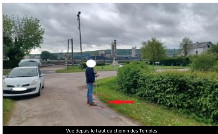
Vue depuis le haut du chemin des Temples

GÉOLOCALISATION Coordonnées WGS84 : X: 0.99794979 / Y: 49.37089830 Coordonnées RGF93 (Lambert 93) X: 554567.98 / Y: 6920885.52 Coordonnées RGF93 (ETRS89) : X: 0.9979498 / Y: 49.3708983 Code Hydro: ----0010 Rive de référence: Droite