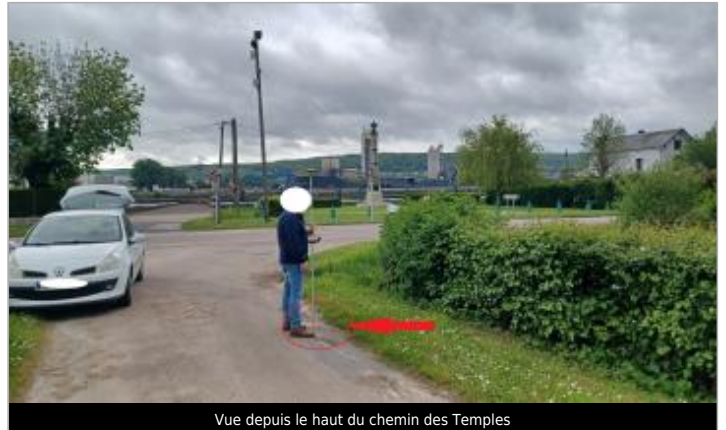
Vue depuis le haut du chemin des Temples

Coordonnées WGS84 : X: 0.99794979 / Y: 49.37089830